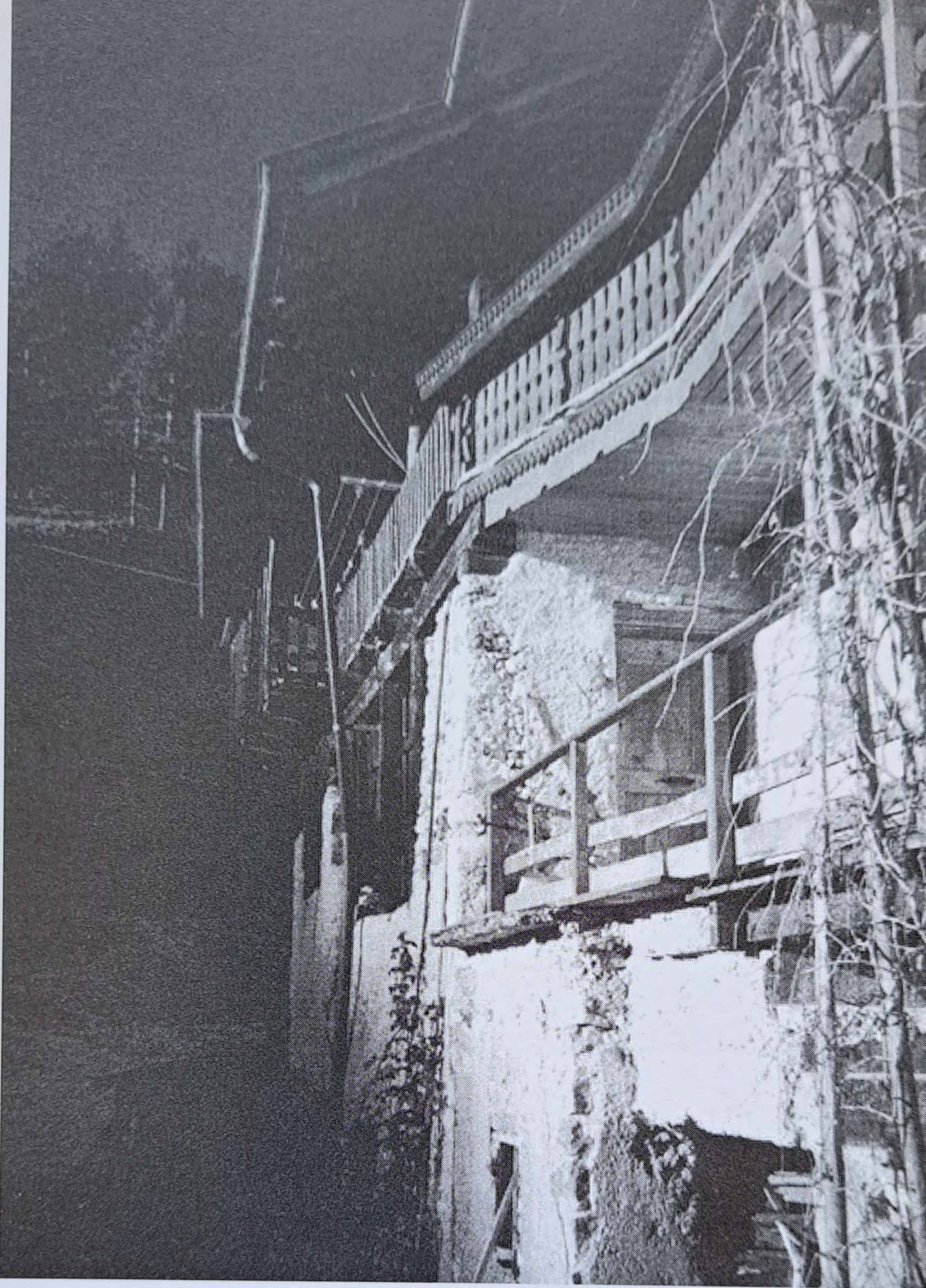
Maso Kornichel. Il nome deriva da "Kornhügel", collina del grano.